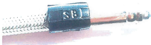
Kennzeichnung Motacc D Presse 1

Hiermit bestätigt die Firma Motacc GmbH, dass die Leitungen mit der Kennzeichnung LGB denen mit der Kennzeichnung SB* , entsprechen . Die Kennzeichnung musste auf Grund einer Erweiterung der Produktionskapazität kurzfristig zusätzlich eingesetzt werden .